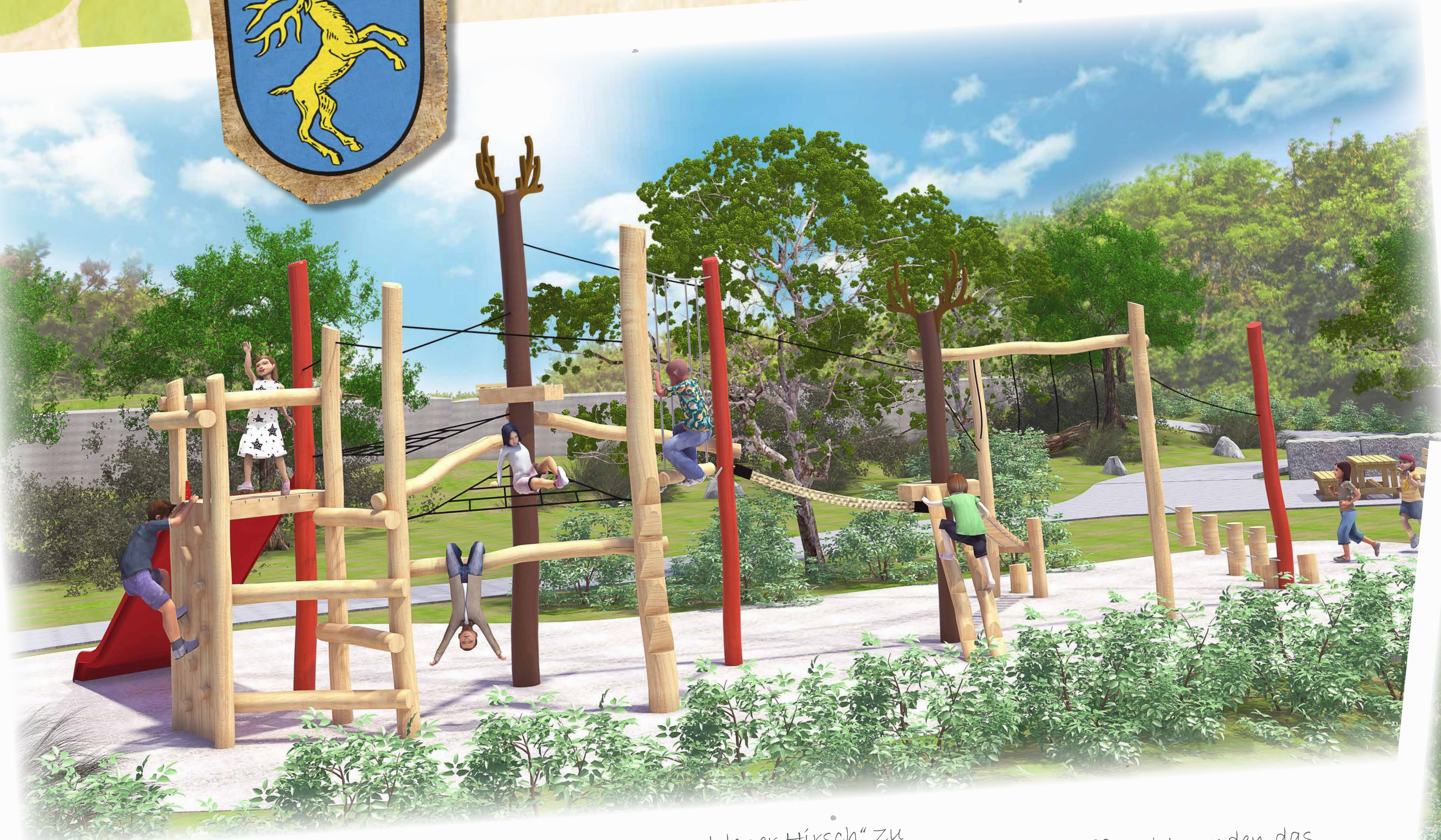
Mit Ihrer verzweigten Struktur fordert die Kletteranlage „Goldener Hirsch“ zu actionreiche Abenteuer auf. Die großzügigen Kletter- und Liegenetze als kommunikativer Treffpunkt runden das Angebot ab.