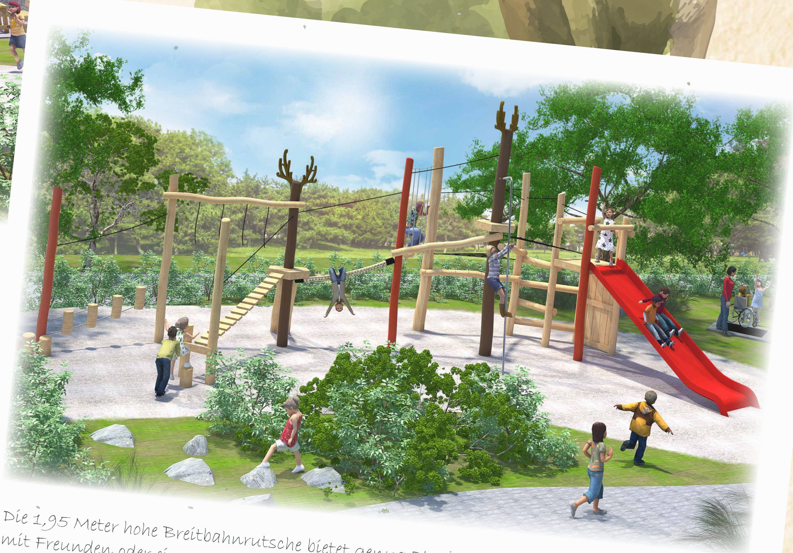
Die 1,95 Meter hohe Breitbahnrutsche bietet genug Platz, um zusammen mit Freunden oder einem Elternteil zu Rutschen.