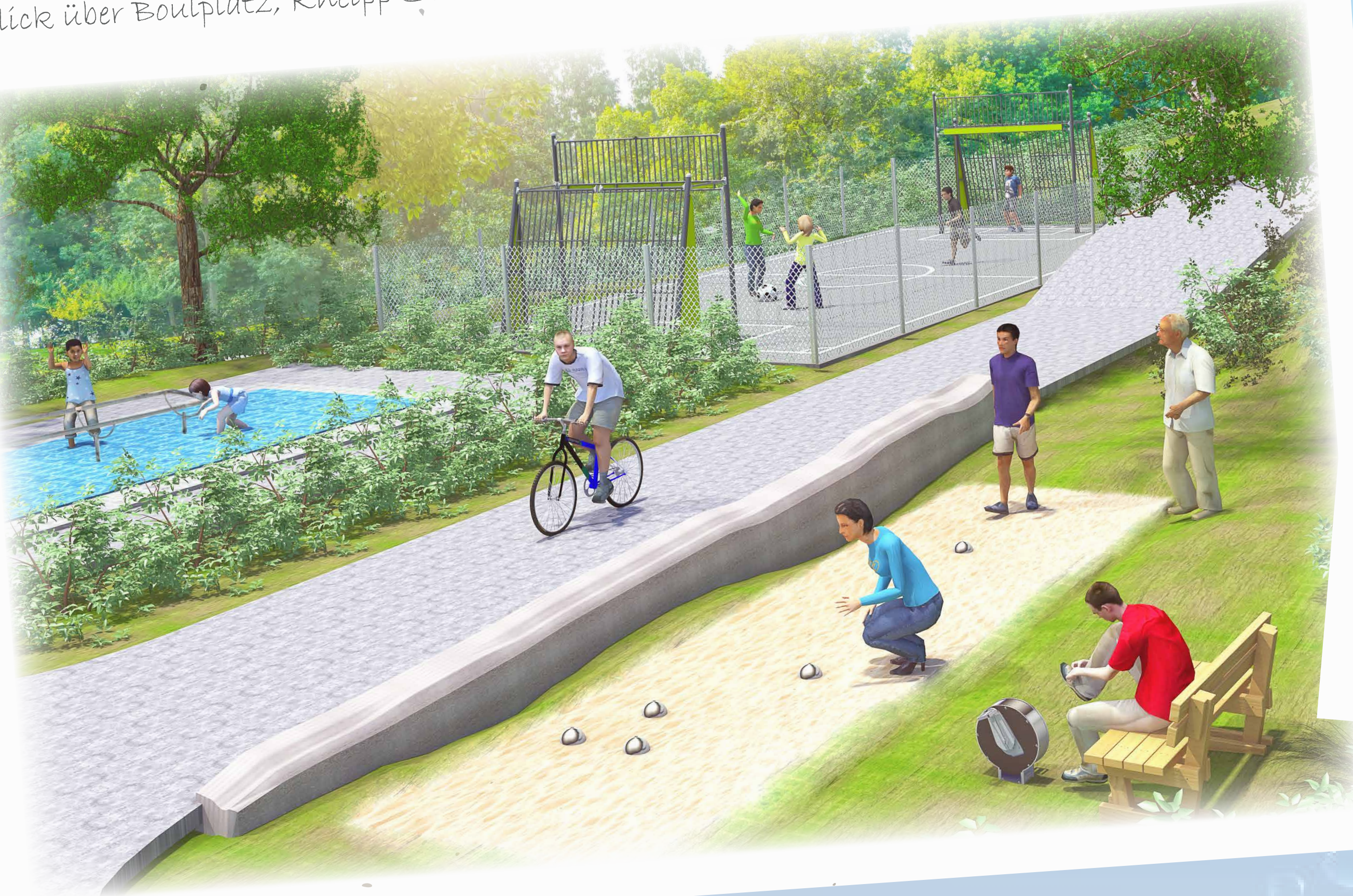
Blick über Boulplatz, Kneipp-Station und Soccer Court.