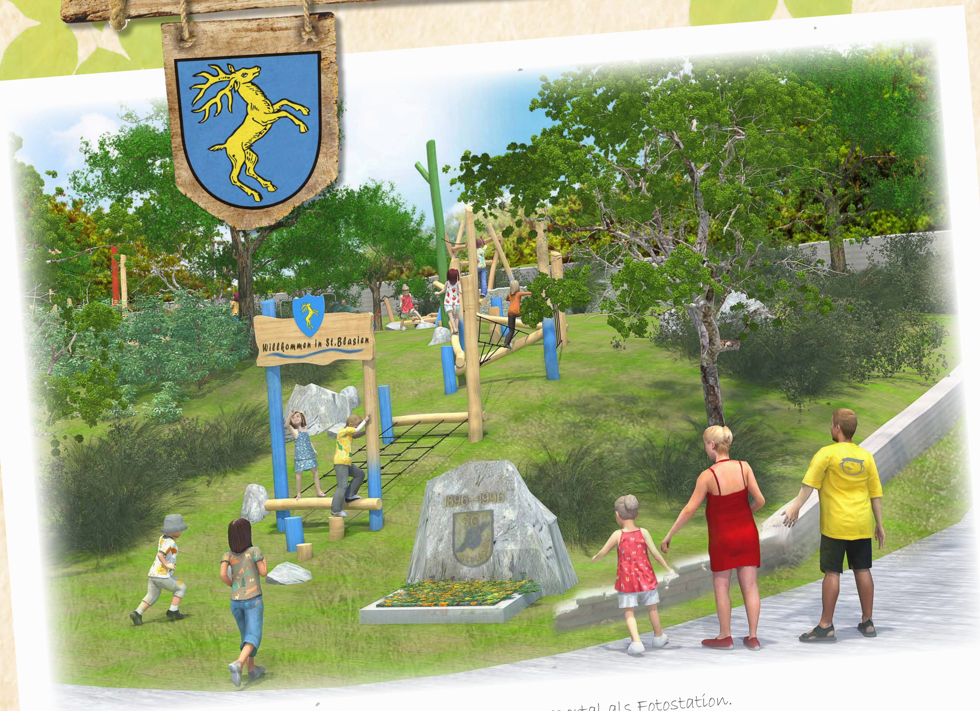
Willkommensblick auf den neuen Kurgarten mit Eingangsportal als Fotostation.