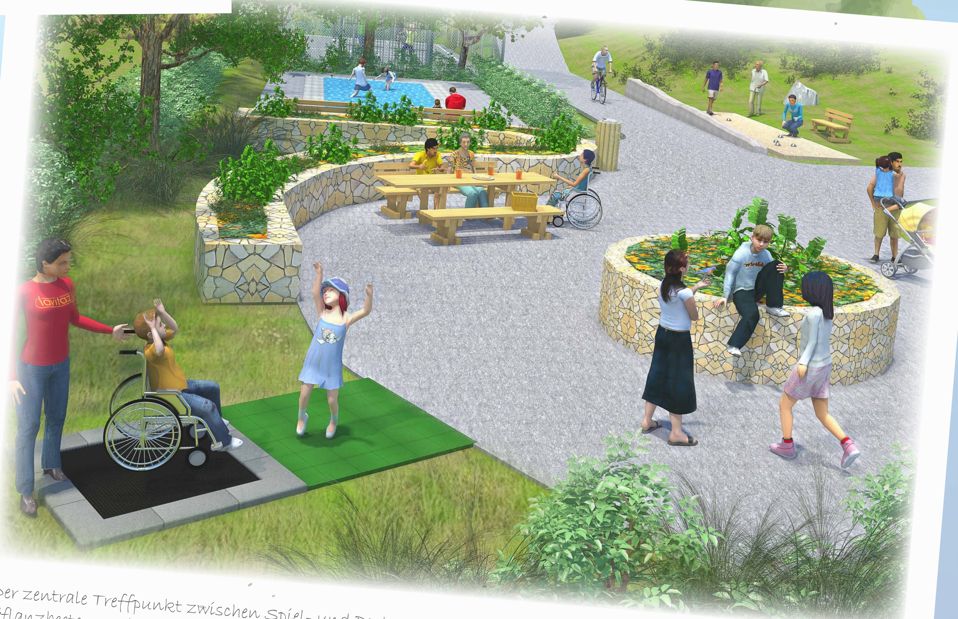
Der zentrale Treffpunkt zwischen Spiel- und Parkerlebnis formt mit seinen duftenden Pflanzbeeten und geräumigen Sitzlandschaften die Aufenthaltsqualität. Aufgrund der guten Zugänglichkeit findet das Trampolinerlebnis hier seinen Platz.