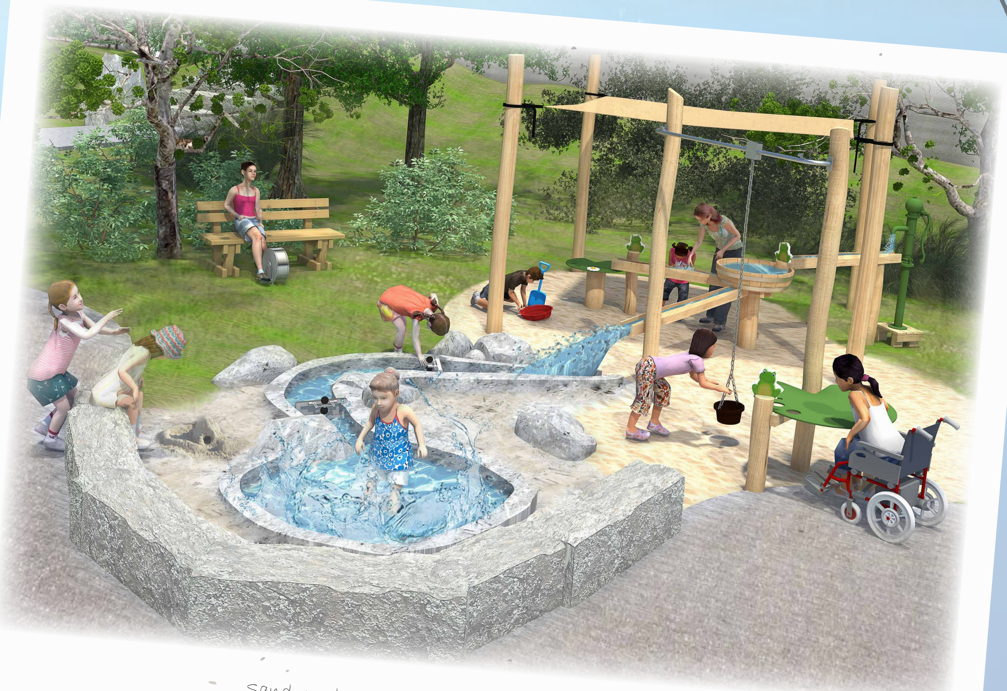
Sand- und Wasserspiel „Froschkonzert“ mit dem Gestaltungsaspekt auf Inklusion. Die angrenzende Parkebank mit Tretrad unterstützt die Bewegung auch beim Sitzen.