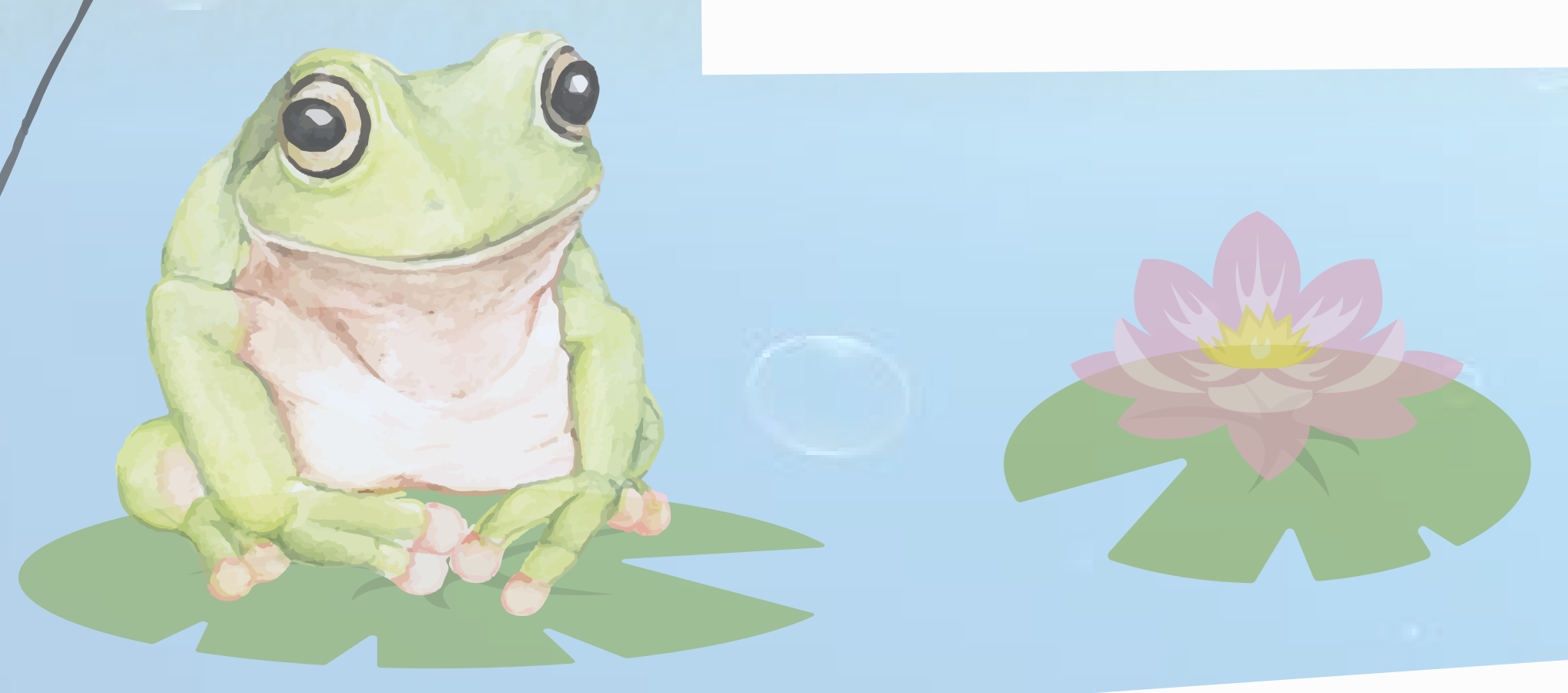
Sandspielanlage, Spielhäuschen und Klangpfosten im „Flussufer-Design“.