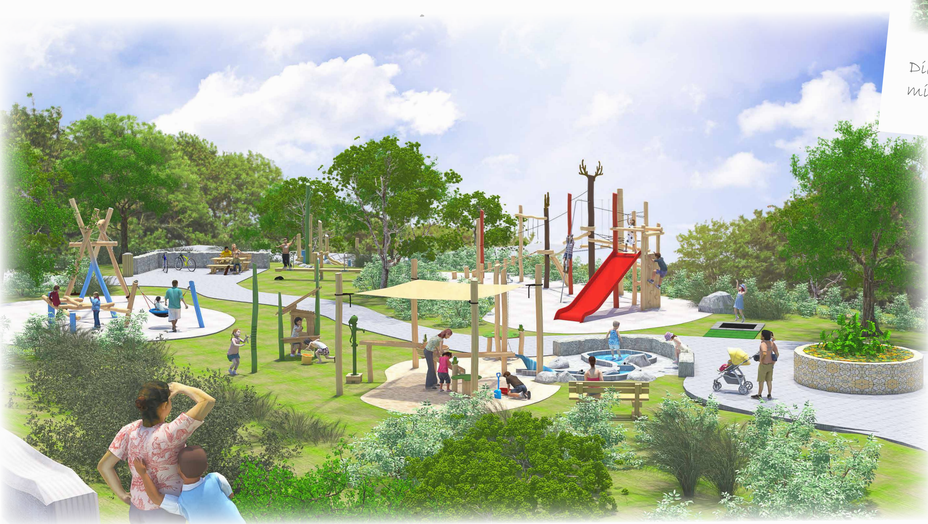
Gesamter Blick über den Spielraum „Flusslandschaft Alb“ mit Kletteranlage „Goldener Hirsch“.