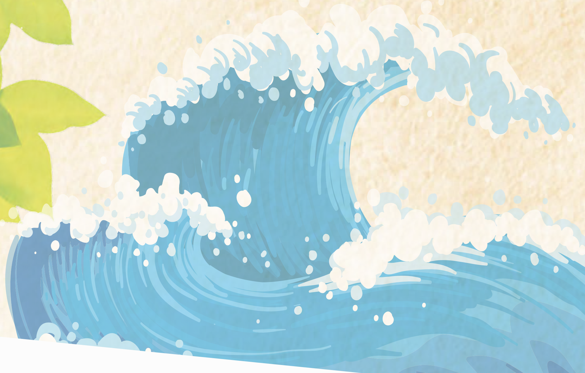
Bewegungslandschaft „Windbergwasserfall“ für alle Generationen.