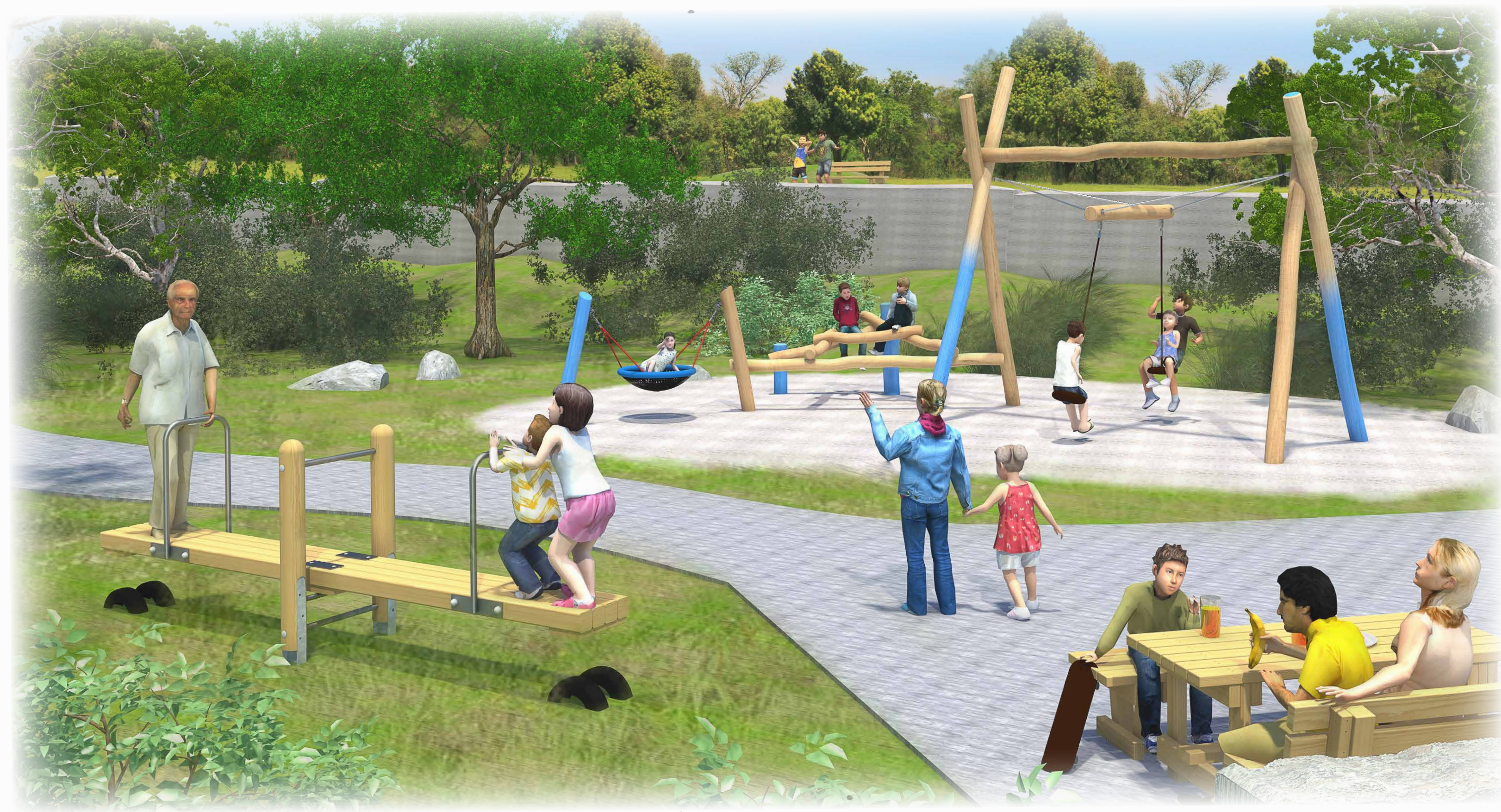
Dynamischer Erlebnispunkt „Flusslandschaft Alb“ mit abwechslungsreichen Funktionen und unterschiedlichen Herausforderungen.