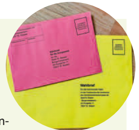
Briefwahlunterlagen der Stadt St. Blasien

Weitere Informationen rund um die Wahlen finden Sie auch auf unserer Homepage unter https://www.stblasien.de/rathaus-service/wahlen.de