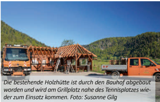
Die bestehende Holzhütte ist durch den Bauhof abgebaut worden und wird am Grillplatz nahe des Tennisplatzes wieder zum Einsatz kommen.

FREITAG, 17. MAI 2024 / NR. 20 | 48. JAHRGANG